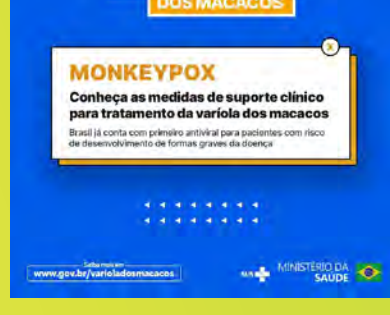
Tratamento da monkeypox