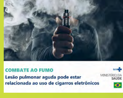
Prevenção ao tabagismo