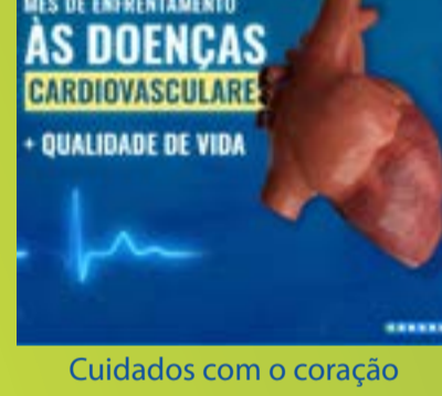
Cuidados com o coração