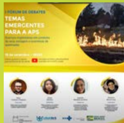
Webinário sobre doenças respiratórias