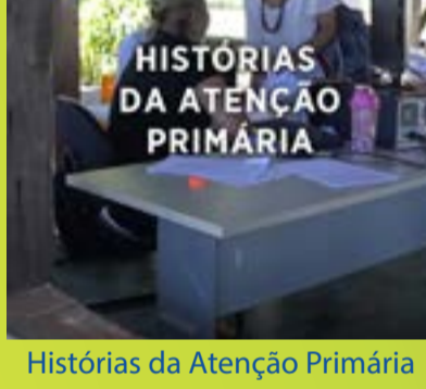
Histórias da Atenção Primária