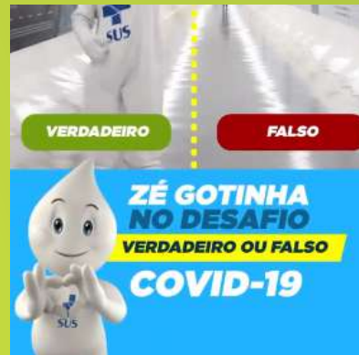
Mais um desafio do Zé Gotinha!