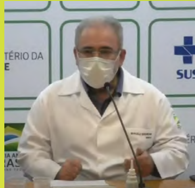
Coletiva de imprensa aos sábados? Temos!