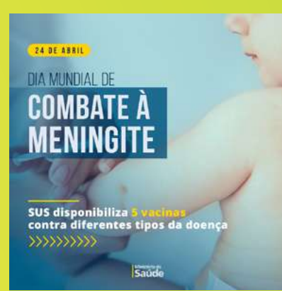
5 vacinas contra a meningite