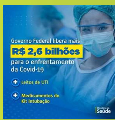
Mais recursos contra a covid-19